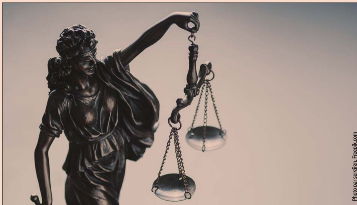
4,3 millions de décisions de justice sont rendues chaque année en France. Un volume qui fait du droit un matériau vivant, nuancé de mille cas particuliers, toujours agrémenté de nouveaux contextes.

Prévoir les verdicts, Grégoire Tomas, VP Marketing & Growth